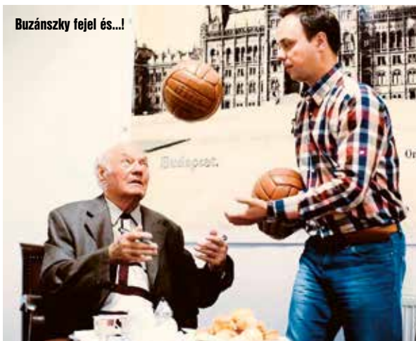
Buzánszky fejel és...!

A 49-szeres válogatott labdarúgó, aki egyébként a legendás csapat egyetlen vidéki játékosa volt, életének mérföldköveiről mesélt szülővárosomban.