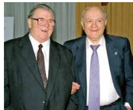
▲ Puskás és Di Stéfano. A közös születésnapon...

Ezt életem egyik nagy hibájának tartom, vagy inkább elszalasztott lehetőségnek. Később azonban tanultam az esetből, mert felfogtam, hogy mekkora értéket jelentenek ezek a találkozók.