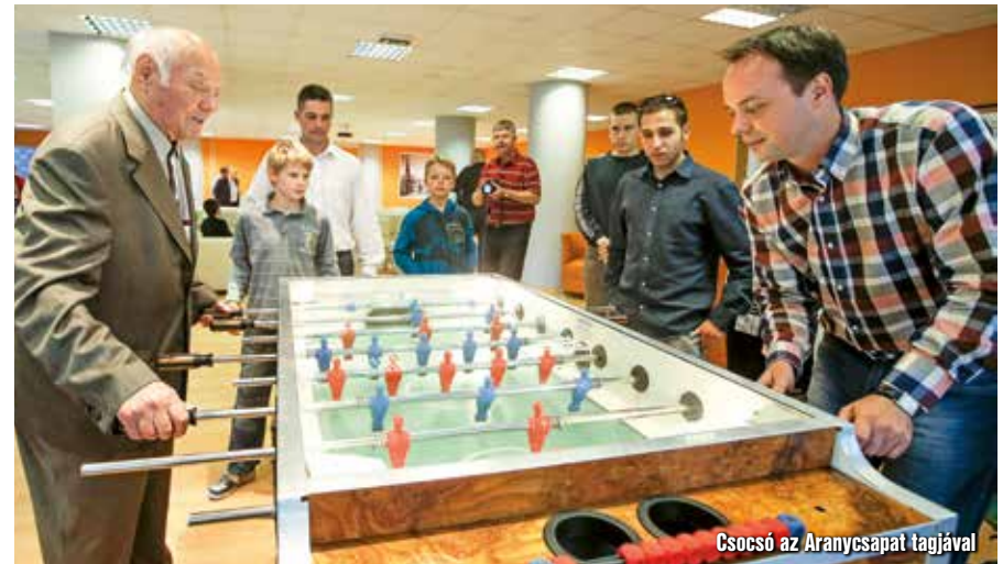
Csocsó az Aranycsapat tagjával

Ott volt alkalmam csocsózni is vele, és büszkén mondhatom, sikerült legyőznöm az Aranycsapat legendás háttvédjét fociban – igaz, csak a csocsóasztalon.